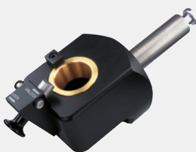
Werkzeugaufnahme SK (DIN / MAS-BT / CAT) 200130 SK / ISO 30 200140 SK / ISO 40 200150 SK / ISO 50