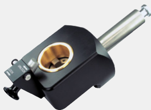
Werkzeugaufnahme HSK - A (DIN 69893/1) 200232 HSK - A 32 200240 HSK - A 40 200250 HSK - A 50 200263 HSK - A 63 200280 HSK - A 80 200210 HSK - A 100