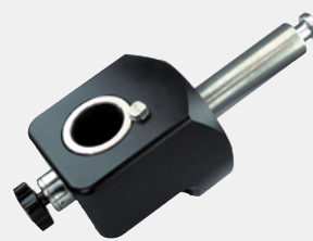
Werkzeugaufnahme VDI (DIN 69880) 200516 VDI 16 200520 VDI 20 200525 VDI 25 200530 VDI 30 200540 VDI 40 200550 VDI 50