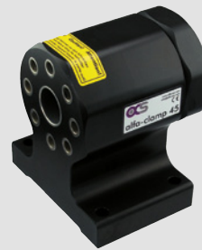
200045 alfa-clamp 45 ohne Werkzeugaufnahmen 8x45° indexierbar