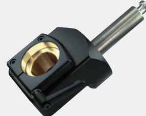
Werkzeugaufnahme Capto 200303 Capto - C3 200304 Capto - C4 200305 Capto - C5 200306 Capto - C6 200308 Capto - C8