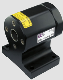
200090 alfa-clamp 90 ohne Werkzeugaufnahmen 4x90° indexierbar